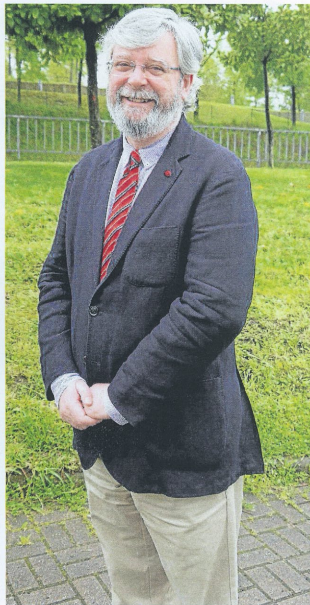
Macho es decano del Colegio Oficial de Químicos de Galicia.

En determinados sectores sí percibimos una pequeña luz al final del túnel, pero otros todavía no. Lo que es cierto es que las mejoras de factores macroeconómicos todavía no han calado en las familias ni en las pymes, por lo que la sociedad no la percibe. Los profesionales agrupados en los colegios sí constatamos que esta situación de crisis tiene salida aunque somos conscientes de que no será inmediata. Lo que es cierto es que tanto la sociedad en general como