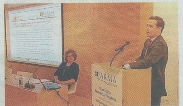
El edificio Quercus acogió ayer las jornadas.

Fue una jornada de trabajo en la que seis expertos ponentes dieron las claves de oportunidad en materia